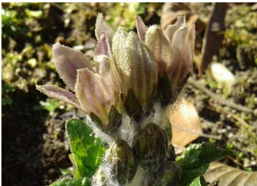
Bloeiende alruin

Pythagoras schreef rond 500 voor Christus al over een minimensje. Volgens de filosofie van wat in latere tijden signatuurleer werd genoemd, geloofde men dat de plant macht had over de menselijke geest en het lichaam. Een magisch mannetje dus... Er zijn overigens niet alleen alruinmannetjes, maar ook alruinvrouwtjes. Mandragora officinarum