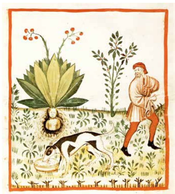
Uit: Tacuinum Sanitatis, 1474

Het verhaal wil, dat je deze plant niet ongestraft kon oogsten. Het alruinmannetje zou dan namelijk een afgrijselijke gil laten horen, waarvan je gek zou worden of waar je aan dood zou gaan. De filosoof en een van de eerste botanici, Theophrastus, schreef dat verzamelaars van deze plant er eerst cirkels omheen trokken en dan de top eraf sneden terwijl ze naar het westen keken. De rest van de wortel werd dan geoogst na het uitvoeren van speciale rituelen.